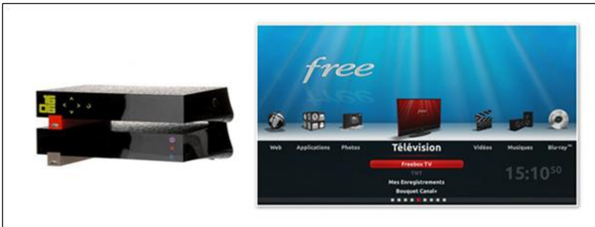
FreeBox connectée à Internet sur TV

Pour pouvoir connecter votre TV à internet via votre box, il peut être nécessaire d'y brancher un dongle (sur un port USB) pour avoir Internet en wifi. Mais cela est aussi possible via un câble RJ45. Néanmoins, de plus en plus de box, Free la première, vous permet d'avoir un accès à une plateforme internet directement via la box (en wifi ou via cable).